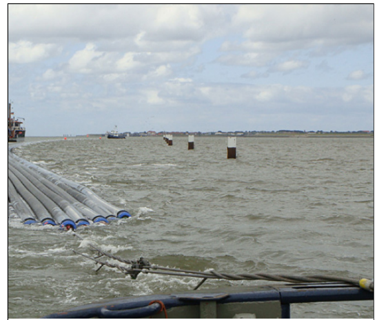
Juli 2010 bis September 2010